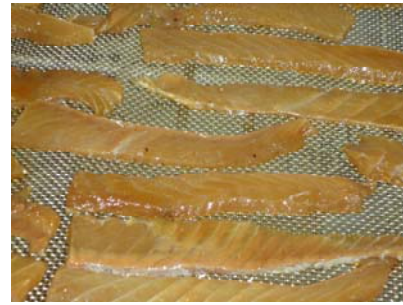
Mynd 1. A. Fyrstu skurðarprófanir. B. lokaafurð skurðarprófana.