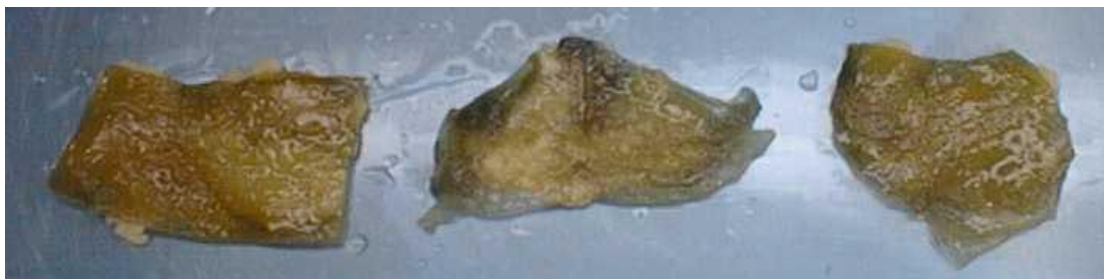
Mynd 3. Basameðhöndlaður frystur, saltaður og þurrkaður hrossapari á hrognaköku.