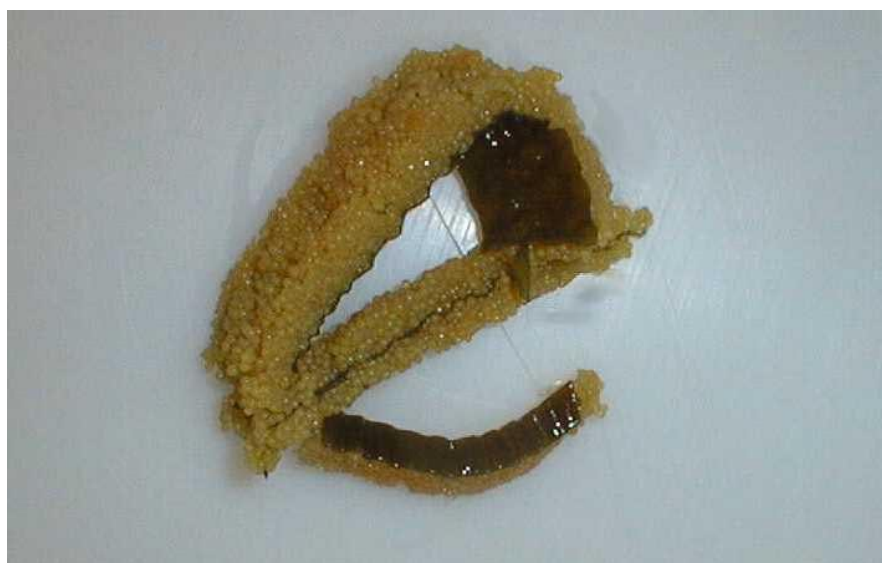
Mynd 1: Kazunoko kombu.

Þarinn í kazunoko kombu má ekki vera þykkur og alls ekki gúmmíkendur, einnig er formið á þaranum mikilvægt fyrir Japani og því stærri sem blöðin eru því betra (Kolbeinn Grímsson 1997). Þær tegundir sem helst koma til greina sem eftirlíking af Laminara japonica eru stórþari ( Laminara hyperborea ), hrossaðari ( Laminara digitata ) og beltisþari ( Laminara saccharina ), og voru þær allar notaðar í verkefninu. Þörungamjölið sem notað var í verkefninu er unnið úr hrossaðara ( Laminara digitata ). Eftir að búið er að slá þarann er hann skorinn niður í bita og þurrkaður. Þegar þarinn kemur úr þurrkaranum er hann malaður, sigtaður og loks sekkjaður. Þar sem nota átti þarungamjölið sem íblöndunarefni og til að búa til eftirlíkingu af þarablaði var talið mikilvægt að fá fín malað þörungamjöl þannig að sem minnst finndist fyrir kornum í kökunni og/eða þarablaðinu.