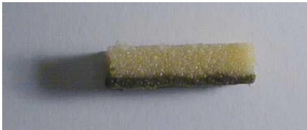
Mynd 2. Loðnuhrognakaka með þörungamjölseigi

Búið var til þörungamjölseig, sem smurt var þunnt á hrognakökurnar þannig að það líktist þarablaði og fest með festilegi II. Var þetta gert með því að setja vatn og alginat út í þörungamjölið í hlutföllunum 77 % vatn, 18 % þörungamjöl og loks 5 % alginat. Eftir að þörungamjölseigið var tilbúið var þunnu lagi smurt á hrognaköku og sett í festibað (sjá mynd 2).